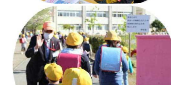
思いやりのある子